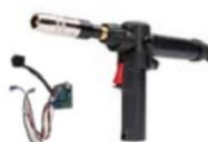
Push-Pull pisztoly + illesztőkártya Kód: 601526000L