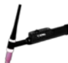
TIG pisztoly Kód: 601294000L