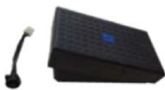
Távírányító LÁBKAPCSOLÓ Cad 4,5m Kód: 600102000L